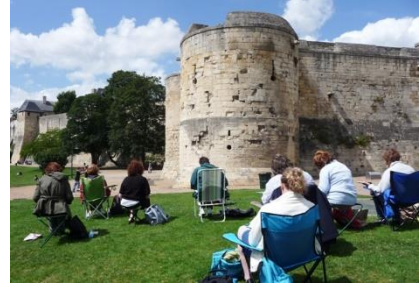
Château de Caen