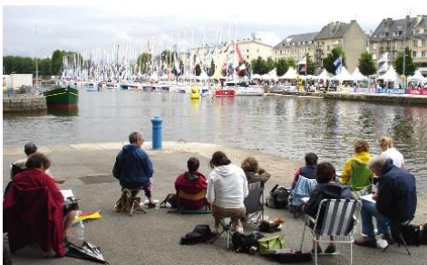
La course du Figaro Caen