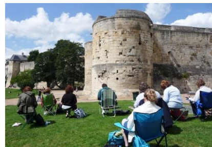
Château de Caen