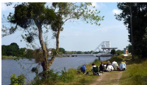
Pégasus Bridge, pont du Débarquement 44

4 livres édités à ce jour, renseignez-vous !!