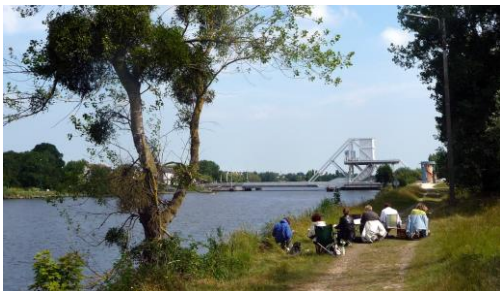
Pégasus Bridge, pont du Débarquement 44

4 livres édités à ce jour, renseignez-vous !!