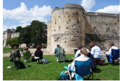
Château de Caen