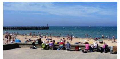
Plage de Courseulles/mer